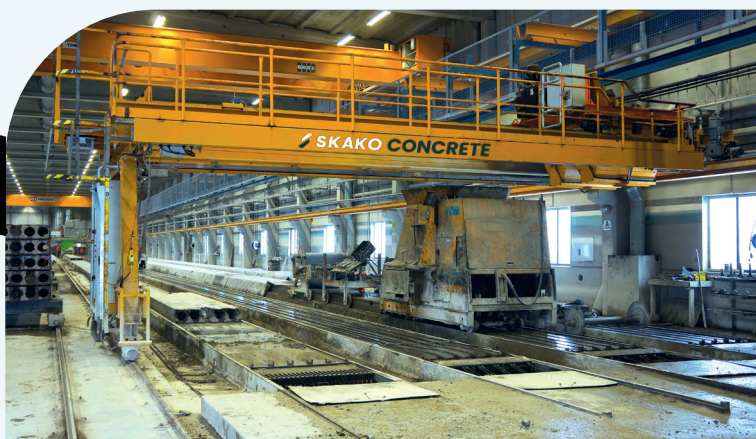
Décharge inférieure - longitudinale